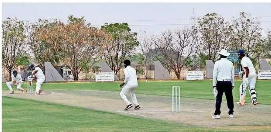
झुंझुनू. ऑल इंडिया इंटर यूनिवर्सिटी क्रिकेट प्रतियोगिता के एक मैच में शॉट लगाने से चुके बल्लेबाज।