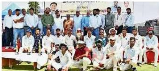
जेजेटी विवि में हुई इंटर यूनिवर्सिटी क्रिकेट प्रतियोगिता की विजेता टीम।

चुड़ैला के जेजेटी विवि में चल रही ऑल इंडिया इंटर यूनिवर्सिटी पुरुष क्रिकेट प्रतियोगिता का खिताब मेजबान जेजेटी यूनिवर्सिटी की टीम ने जीत लिया है। सोमवार को हुए फाइनल मैच में जेजेटी की टीम ने पूर्वांचल यूनिवर्सिटी जौनपुर की टीम को रोमांचक मुकाबले में 7 रन से हरा दिया। इस प्रतियोगिता को जीतने वाली जेजेटी प्रदेश की पहली यूनिवर्सिटी बन गई है। इससे पहले फाइनल मैच में टॉस जीतकर पहले बल्लेबाजी करने उतरी