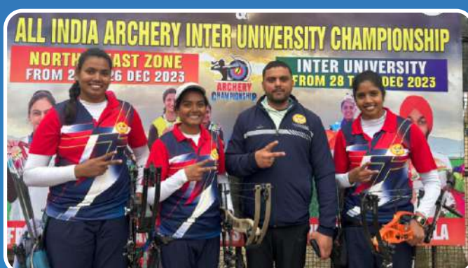
All India Inter University Archery (Women) 2023-24 Champion