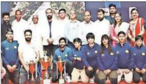
झुंझुनू: अतिथियों के साथ विजेता टीम के खिलाड़ी।