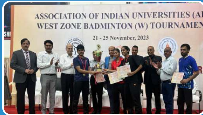
All India Inter University Badminton (Women) 2023-24 Runner up