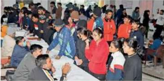
झुंझुनूं, ताइक्वांडो प्रतियोगिता के लिए पंजीकरण कराते विवि के खिलाड़ी।