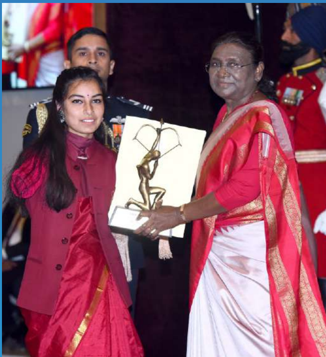
Ms. Sheetal Devi Archer