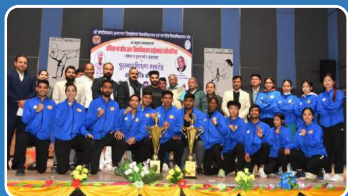
All India Inter University Taekwondo (M&W) 2023-24 Champion