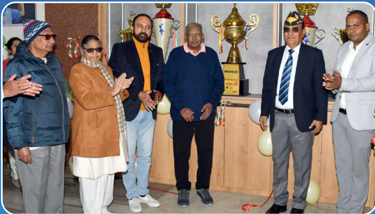
Inaugurated by LT. GEN. Satya Pal Katewa, PVSM (Retd.)