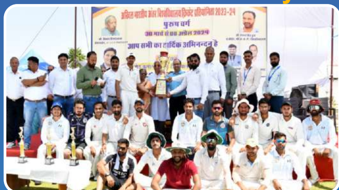
All India Inter University Cricket (Men) Tournament 2023-24 Champion.