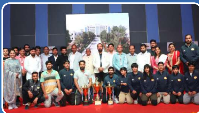
All India Inter University Grappling (M&W) 2023-24 Champion.