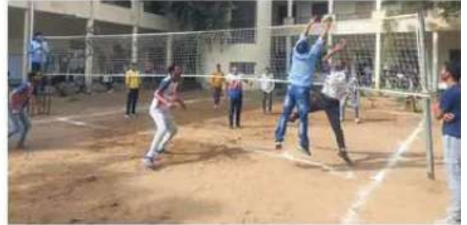
झुंझुनूं, वॉलीबॉल प्रतियोगिता में पॉइंट बनाने की कौशिश करते खिलाड़ी।