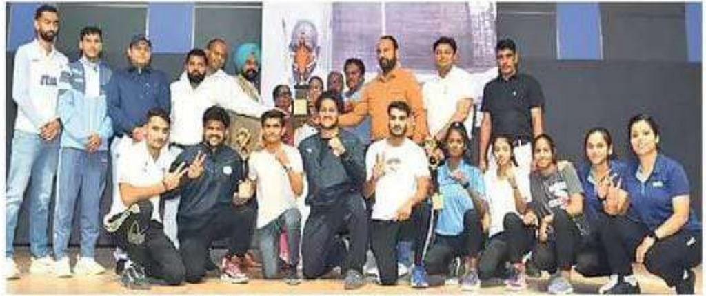
झुझुनूं, क्वान कीडो प्रतियोगिता के विजेताओं का सम्मान करते अतिथि।