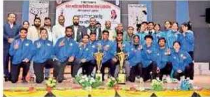
झुंझुनू, ताइक्वांडो प्रतियोगिता की चैम्पियन टीम के साथ अतिथि।

महिला वर्ग में एमडीयू रोहतक ने 2 गोल्ड समेत 8 मेडल जीतकर दूसरा स्थान पाया