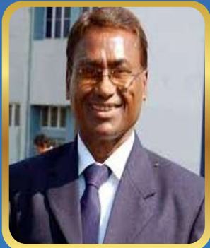
Shri Ashok Dhyanchand Olympic Gold Medalist (Hockey)