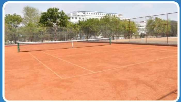
Lawn Tennis Court