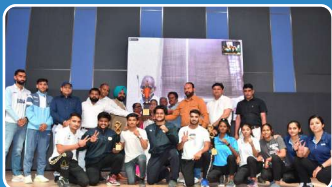
All India Inter University Qwan Ki Do (M&W) 2023-24 Champion