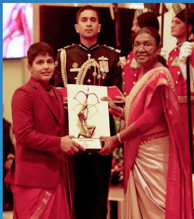
Ms. Antim Panghal Wrestler