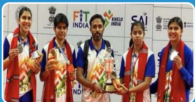
Shri JJT University Badminton Women Team Runner up in Khelo India University Games 2023-24