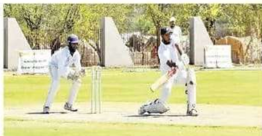
झुंझुनू, शॉट लगाने का प्रयास करता बल्लेबाज।